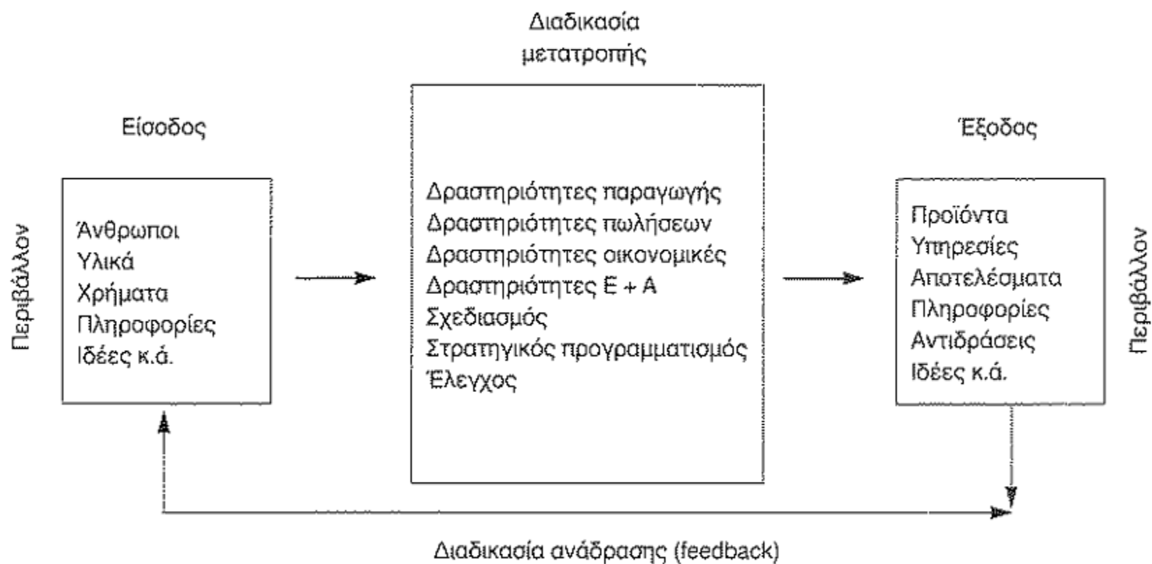
ΣΧΗΜΑ 10.1: Ο κύκλος «είσοδος – έξοδος» («input – output») σε ένα σύστημα.